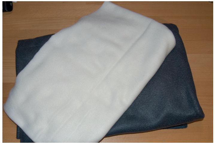
Normale (dünne) Polarfleecedecken

soweit bin, dann schicke ich sie los. Ich hätte nie gedacht, dass sie so viel Freude daran haben würden! Probieren Sie es mal aus. Mittlerweile habe ich alle Hunde im Freundeskreis ebenfalls mit einem Schnüffelteppich ausgestattet und alle Hunde finden es toll.