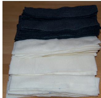
Die langen Streifen ...

... müssen dann noch entsprechend gekürzt werden