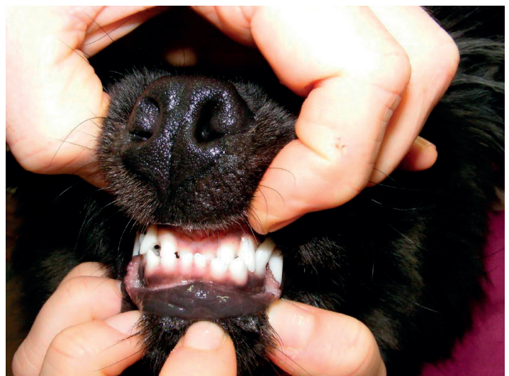
Vorbiss erwachsener Hund

Je nach Ausprägung haben die Hunde mit Vorbiss weniger klinische Probleme.