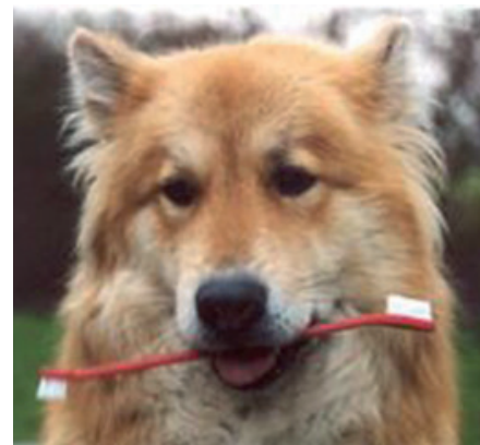
Fleißig Zähne bürsten!