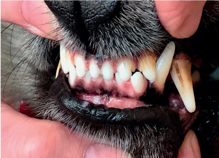
Einzelzahnfehlstellung - I3 unten steht vor dem Oberkieferzahn

Klasse 1 definiert Einzelzahnfehlstellungen bei korrekten Kieferlängen, dazu zählen der Caninussteilstand, nicht ausgefallene (also fehlerhaft bleibende) Milchzähne, oder ein lanzenartig herausstehender Caninus („Lanzencaninus“). Weiter zählt auch das Zangen-Gebiss dazu, wo im Gegensatz zur Schere die Schneidezähne direkt aufeinandertreffen – eben wie bei einer Zange. Diese Erscheinungen werden als sehr wahrscheinlich nicht erblich deklariert.