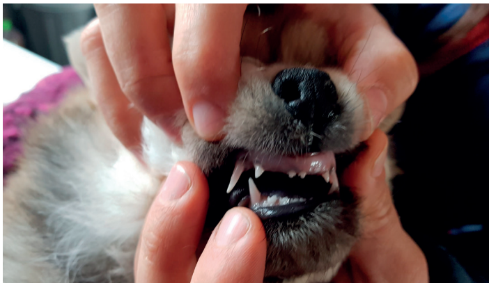
Incisivi fehlen beim Welpen-Gebiss

Die Welpen wechseln ihr Milchgebiss etwa vom dritten bis siebten Lebensmonat an in das endgültige bleibende Gebiss. Milchgebiss und bleibendes Gebiss als zwei Zahngenerationen haben zwei voneinander getrennte Zahnanlagen. Fehlen Welpenmilchzähne, bedeutet dies nicht, dass diese auch im endgültigen Gebiss fehlen müssen.