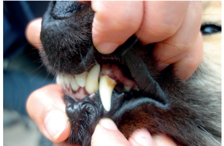
Zahnstein-Zahnbelag am Fangzahn

Ein intaktes Paradont umschreibt einen unauffälligen Zahn in seinem Zahnhalteapparat. Vier von fünf Hunden mittleren Alters leiden an Erkrankungen des Paradonts, der häufigsten oralen Erkrankung beim Hund. Auf den Zahnoberflächen bildet sich ein Biofilm, der sich aus Bakterien, Entzündungszellen, Speichelbestandteilen und Abbauprodukten zusammensetzen kann. Mineralisiert dieser Film durch Bestandteile des Hundespeichels, bildet sich Zahnstein, auch Plaque genannt.